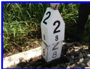
廃プラポストに被せるだけ