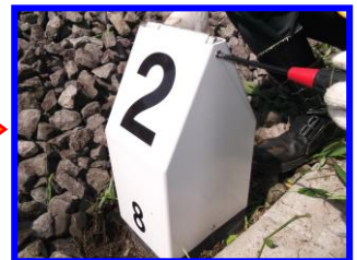
ビスで固定すればOK！