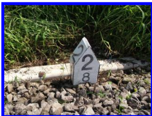
見にくくなった諸元標示

4 各メーカーの廃プラ3号標に合うフリータイプです。 各メーカーにより廃プラのサイズが若干違いますが、全てに合うフリータイプ設計です。 サイズ調整出切るスペーサーを一緒にご用意しております。