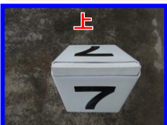
横幅 140 mmタイプ スペーサー装着