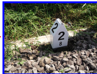
メンテナンス終了！