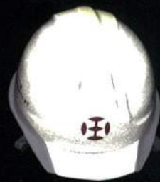
再帰反射ヘルメット