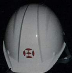
無反射ヘルメット