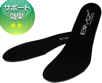
キューボイドバランス アスリート 3.5

カラー：ブラック サイズ：XS 22.0~23.0cm S 23.5~24.5cm M 25.0~26.0cm L 26.5~27.5cm XL 28.0~29.0cm 表面素材：EVA樹脂 底面素材：特殊高反発弾性体