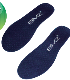
キューボイドパワー オールフィット

カラー：ネイビー サイズ：XS 22.0~23.5cm S 24.0~24.5cm M 25.0~25.5cm L 26.0~26.5cm XL 27.0~28.5cm 表面素材：人工レザー 底面素材：特殊高反発弾性体