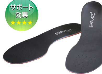
キューボイドパワー スマートスポーツ

カラー：ブラック サイズ：XS 22.0~23.0cm S 23.5~24.5cm M 25.0~26.0cm L 26.5~27.5cm XL 28.0~29.0cm 表面素材：人工レザー 底面素材：特殊高反発弾性体